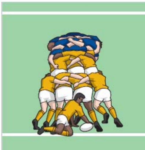
„Pushover“ - Versuch