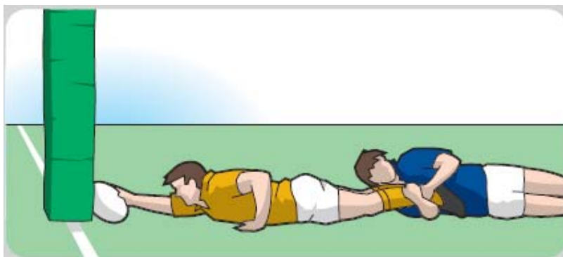
Den Ball gegen die Malstange ablegen