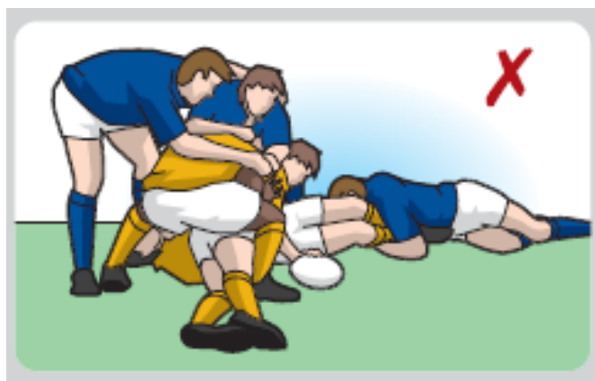
Spieler sind nicht auf den Füßen und spielen den Ball.