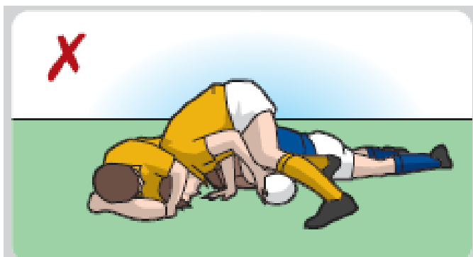
Ein Spieler ist nicht auf den Füßen und spielt den Ball.